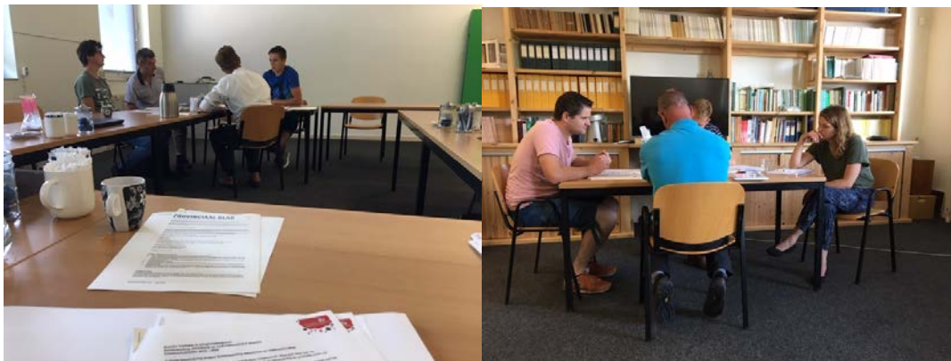
Afbeelding 1: In groepjes aan het werk tijdens de expertsessie.

Na aanleiding van deze sessie zijn er duo's tussen experts/adviseurs gevormd welke samen een samenwerkingsverband gaan begeleiden om de training uit te voeren.